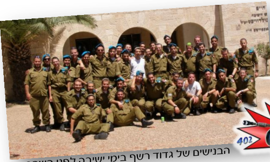
הבנינים של גדוד רשף בימי ישיבה לפני השחרור